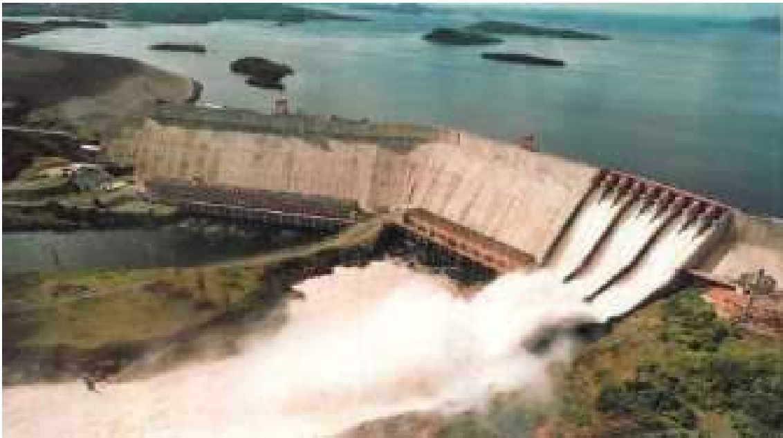
Represa del Gurí- Central Hidroeléctrica Simón Bolívar – Venezuela

La fauna terrestre es desplazada hacia las áreas aledañas al embalse, que no siempre son adecuadas para su supervivencia y debe competir con las poblaciones ya existentes en ellas (aves, mamíferos grandes y medianos, reptiles grandes, algunos insectos voladores), o muere ahogada durante la inundación (mamíferos y reptiles pequeños, anfibios, la mayoría de los insectos, arañas, caracoles y lombrices, entre otros). Las praderas, bosques, tierras de cultivos y hasta los centros poblados cercanos son cubiertos por las aguas, muere indefectiblemente toda la vegetación y su lenta descomposición condiciona la calidad de las aguas embalsadas.