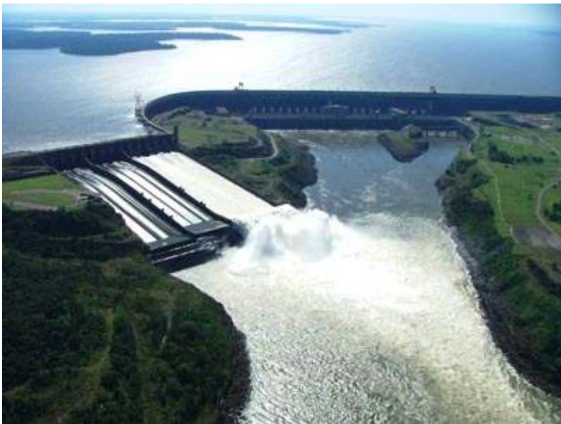
Represa Hidroeléctrica Binacional Itaipú sobre el Río Paraná

Las mega represas o grandes represas son monumentales obras de ingeniería cuya altura de cortina es de 15 metros o más, o si tienen una altura de entre 5 y 15 metros con una capacidad de embalse a más de 3 millones de m 3 de agua, según la clasificación de la Comisión Internacional de Grandes Represas (ICOLD en inglés) - establecida en 1928 - construyéndose la mayoría de ellas sobre los ríos de llanura 5 más caudalosos del planeta, como por ejemplo Itaipú y Yacyretá en el río Paraná; Salto Grande en el río Uruguay; Assuán en el río Nilo; Represa Tucuruí sobre el río Tocantins en el Brasil, Upper Krishna en la India, entre las más importantes, originando importantes y sustantivos cambios socio ambientales, en muchos casos irreversibles, en las áreas geográficamente de influencia.