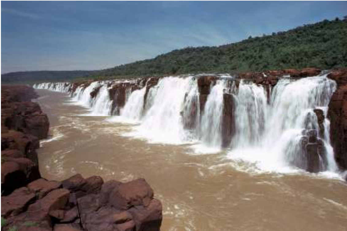
Saltos del Moconá

En el año 1991 se produce una paralización del proyecto como corolario de nuevas condiciones del sector energético en la Argentina y el Brasil, retomándose a partir del año 1996, pero el surgimiento de crisis económicas en los países de la región y la resistencia de movimientos sociales paralizan nuevamente los estudios.