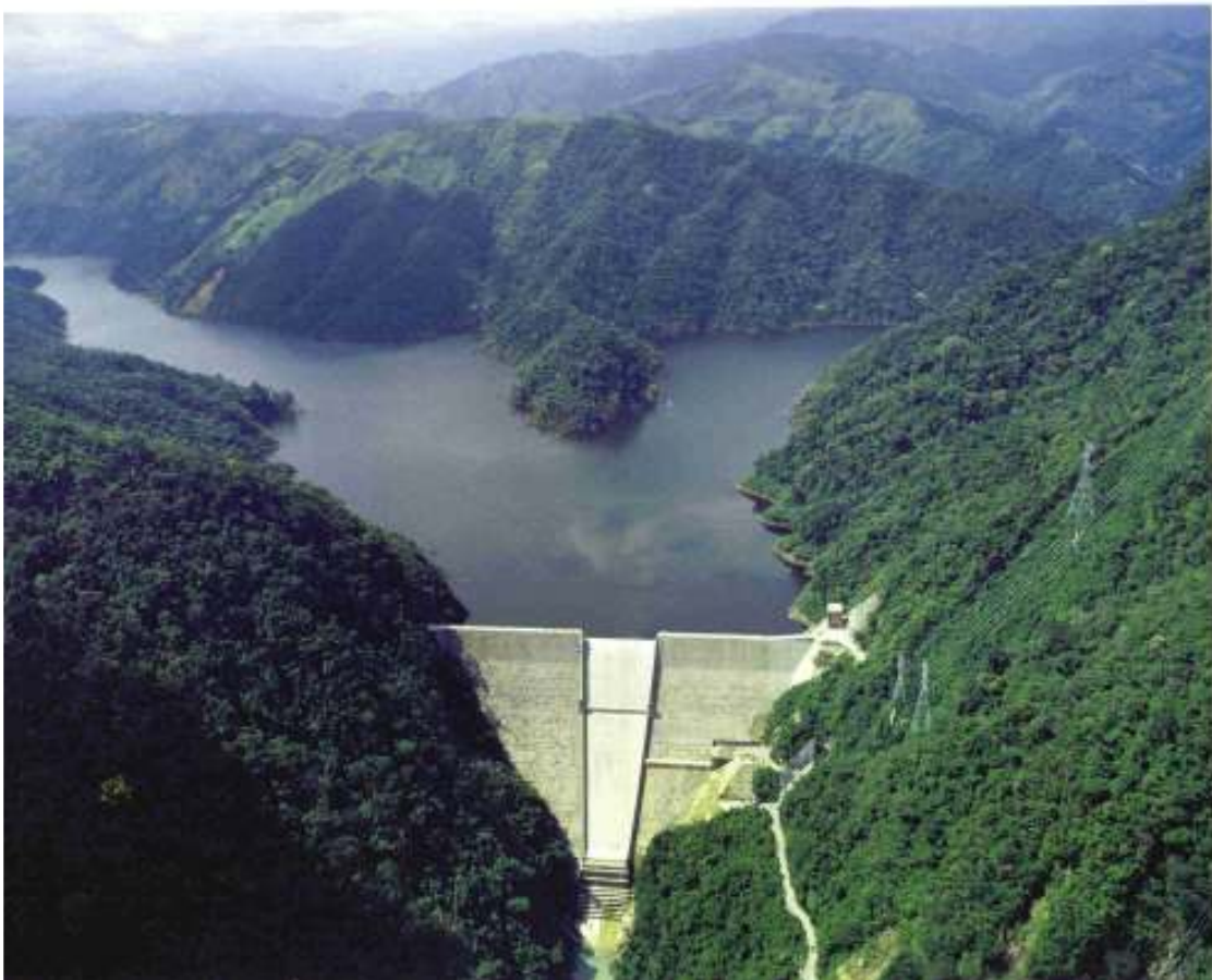
Represa Hidroeléctrica Miel 1 – Colombia - www.norcasia-caldas.gov.co

A menudo, los habitantes de las grandes ciudades, los intereses agrícolas, los corredores inmobiliarios y las industrias de los conglomerados urbanos, disfrutan de los beneficios de las represas, pero quienes viven en la zona de influencia de estos embalses son quienes realmente soportan los costos ambientales y sociales, beneficiándose en un grado sustantivamente menor o directamente nulo. Baste como ejemplo que a la fecha se están planificando cortes regulares de energía eléctrica en la provincia de Corrientes por falta de abastecimiento de electricidad, paradójicamente es en esta provincia donde está emplazada la megarepresa de Yacyretá 15 .