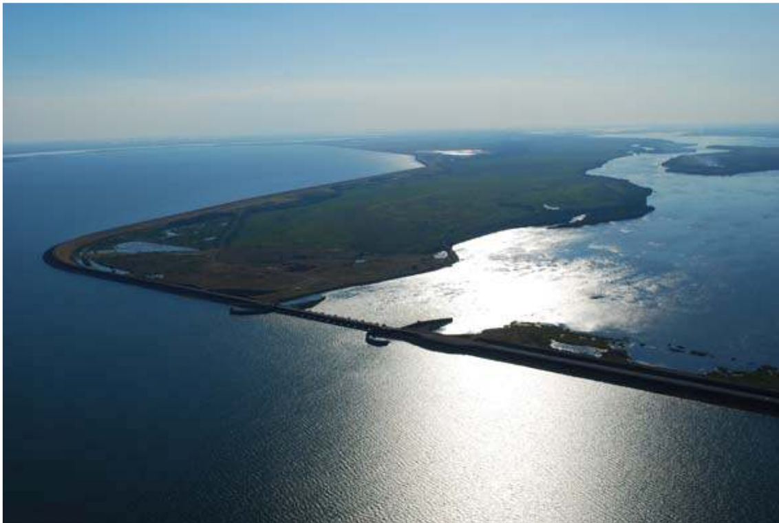
Vista aérea de la Represa Hidroeléctrica Binacional Yacyretá sobre el río Paraná – Yacyretá.INFO

Antecedentes sobre este accionar se encuentran registrados en las historias de Salto Grande y Yacyretá, y ahora pareciera seguirse el mismo camino con Garabí, aduciendo que lo que pasó y lo que actualmente pasa con estas mega obras ya funcionando, sólo son errores de gestión y no innegables consecuencias de la construcción de mega represas.