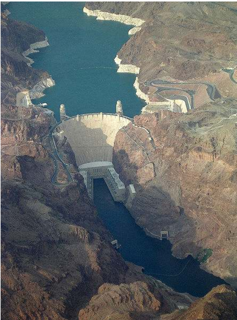
Presas Hoover sobre el río Colorado – USA

En noviembre de 2009 los presidentes de Argentina y Brasil firman en la ciudad de Brasilia un acuerdo para instrumentar la formación de la Empresa Mixta Internacional que supervisará la construcción, operación y mantenimiento del complejo Hidroeléctrico Binacional Garabí. A pesar de no estar concluidos aún los estudios de inventario de los anteproyectos de factibilidad que fueran encomendados a las consultoras Proa, Esin y Cenec, ambos países se aprestan a evidenciar un acto de voluntad política que pretendería instalar a esos proyectos en un camino sin retorno.